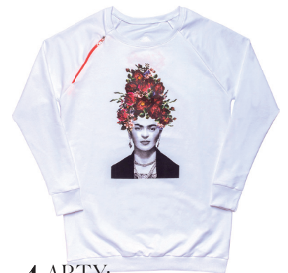
4 ARTY: Duks s likom Frida Kalo, zagaclothing.com, 9.800 din., na snižanju 6.800 din.

Za čime sve uzdišemo ovog meseca? Redakcija izdvaja svoje favorite