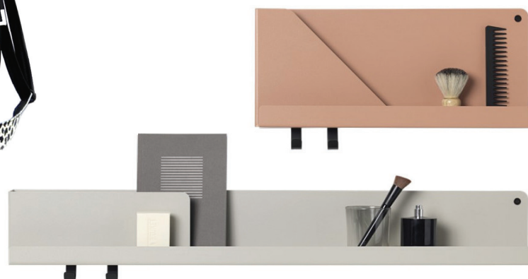
6 ELEGANTNO & SAVREMENO: Folded Shelves by Johan van Hengel for Muuto (www.gir.rs), cena na upit