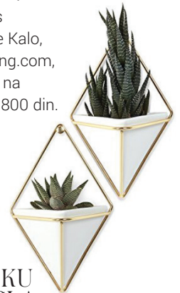
5 U OBLIKU TROUGLA: TRIGG zidne vaze Umbra (www.kytak.rs), dva komada 3.630 din.