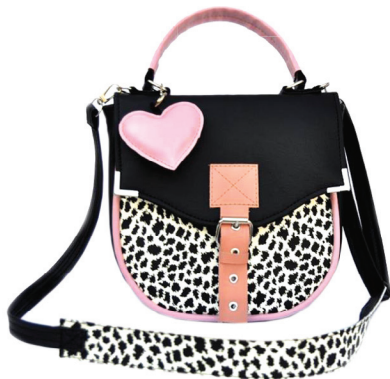
7 MODNI MIX: Torbica handmade Berkesel, 4.200 din.