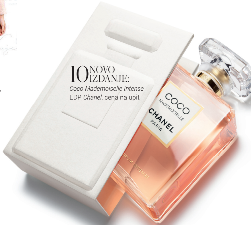
10 NOVO IZDANJE: Coco Mademoiselle Intense EDP Chanel, cena na upit