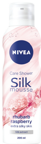
8 KOŽA POPUT SVILE: Care Shower Silk Mousse Rhubarb&Raspberry Creme Smooth NIVEA, 333 din.