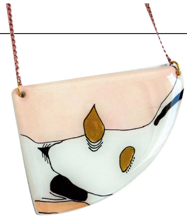
2 OD GLINE: Ogrlica Bi Žu, 1.900 din.